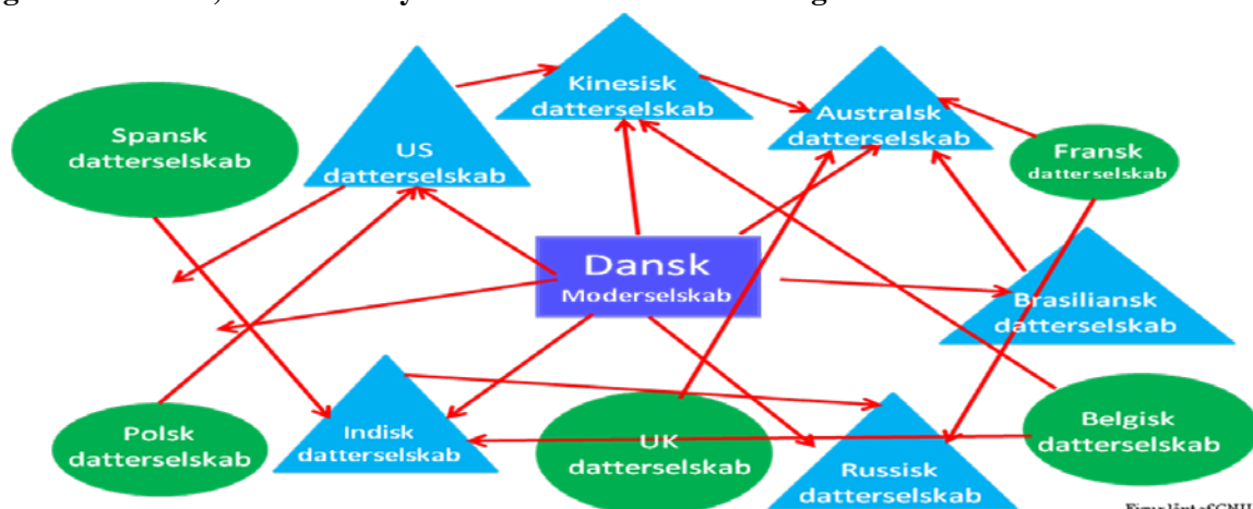
Figur 3: Koncern, der ikke benytter bindende virksomhedsregler

Figur 3 viser et eksempel på kompleksiteten i forhold til overførsel af personoplysninger i en koncern, der ikke har bindende virksomhedsregler. For hver enkelt pil vil der skulle foreligge et garantigrundlag, f.eks. standardbestemmelser eller ad hoc-kontrakter.